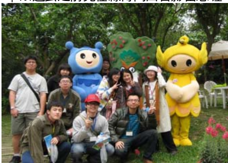
↑※在園區遇到超卡哇伊的綠博小精靈

「叩！叩！叩！」此起彼落的槌打聲，響徹屋內，瞧！大伙正聚精會神的在忙著做木屐鑰匙環！從將皮件弄濕、雕刻、上色、吹乾、上光—按部就班，一個屬於自己獨