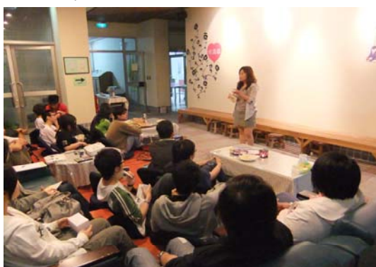
↑※小而美的溫馨庭院電影院坐無虛席