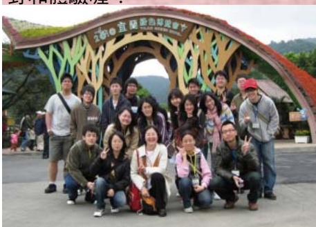
↑※進去之前先在綠博門口合影留念喔

透過互動、知性及寓教於樂的活動設計，傳播時下很夯的綠色概念與環保精神，提供了不同的新視野和體驗喔！