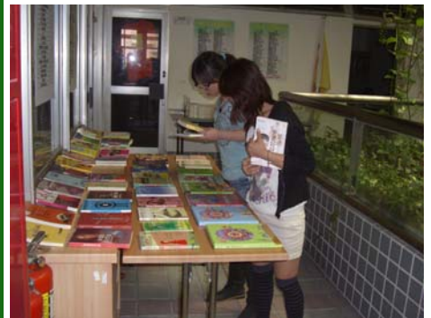
↑ ※在中庭展示書籍，大家自由閱讀