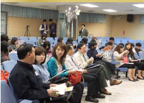
↑※開場前老師們彼此討論著