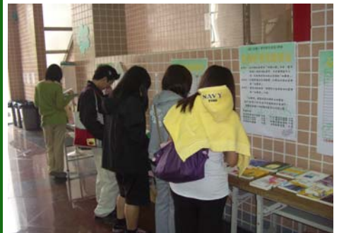
↑ ※地點移到體育館一樓，對書展有興趣的同學更多囉！