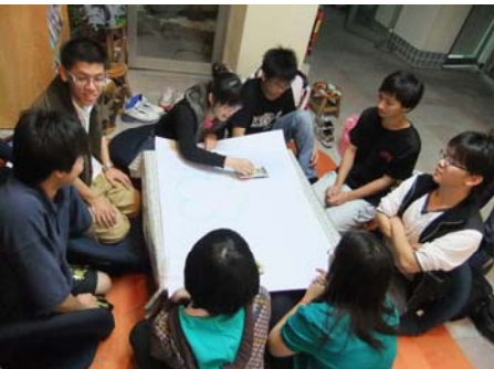
↑※畫出我們的夢想異次元！相互勉勵逐夢踏實

同學可以寫下給自己或朋友未來的祝福，真情電力公司會在 60 天後真心遞送這張小卡，讓未來的自己可以接收到最真摯的祝福！。