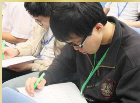
↑※同學專心的寫著手上的資料

本營隊結合宜蘭大學與佛光大學的專業心理諮商師資，設計多元的教學方式，從專題講演、團體課程，到分組活動，透過專業知識的