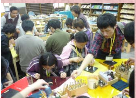
↑※「叩！叩！叩！」此起彼落的槌打聲

「叩！叩！叩！」此起彼落的槌打聲，響徹屋內，瞧！大伙正聚精會神的在忙著做木屐鑰匙環！從將皮件弄濕、雕刻、上色、吹乾、上光—按部就班，一個屬於自己獨