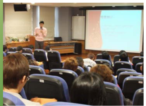
↑ ※藉由活動增進同學對諮商中心的了解

播畢後的座談之中，諮商股長們紛紛表示自己更知道如何同理他人的需求，以及要適時的對週遭情緒困擾的同學伸出援手。最後，帶領老師分享一些實用的助人小技巧，使大家都更滿懷熱忱，並更有信心接受這份有意義的挑戰—成為「助人守門員」！