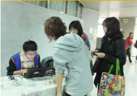
↑※志工熱心的幫同學完成報到手續

本次活動參加人數共 40 人，除宜蘭大學學生外也有不少同學是來自於佛光、世新、交大等學校，同學們對於參加本次活動的反應也很熱烈，有 54% 的同學都覺得參加營隊後對自己的未來更能清楚掌握，在面對重要生涯抉時也不再擔心、害怕。