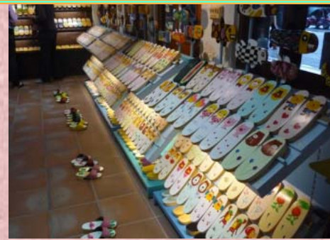
↑※各式各樣色彩繽紛的木屐

除了欣賞，還提供試穿體驗，只見同學們興致高昂的穿著木屐走來走去，耳邊不時傳來「叩啦！叩啦！」的木屐聲！