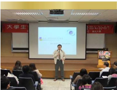
↑※學務長精彩的開場