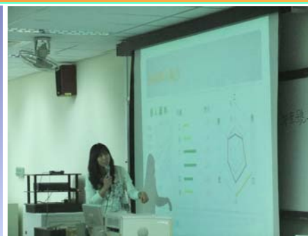
↑※老師先向同學介紹本次測驗的目的

此次活動參與人數約 2,000 人，分成 42 個班級，也因此動員了諮商中心所有人員協助這項活動，本次活動感謝學校各單位的幫忙與協助，尤其是各班諮商股長每位都花了很多時間在協調同學的測驗時間與活動的進行上。