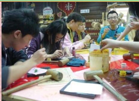
↑※大伙聚精會神的在忙著做木屐鑰匙