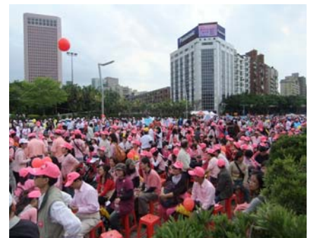
↑※辛勞的代價～滿滿的人潮