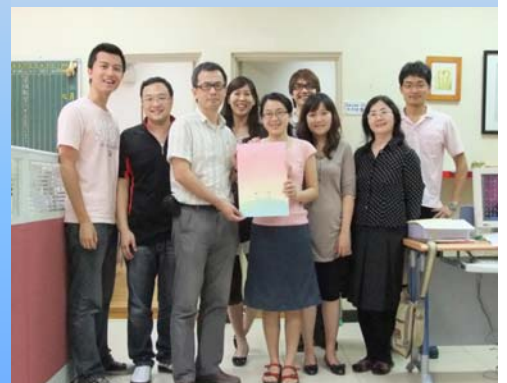
↑※諮商中心教職員全體合照

「義形工場」 志工團 ，有了他們的分工合作，希望能讓每位蒞臨心靈花園的宜大人都能在心田裡綻放出美麗的花朵。