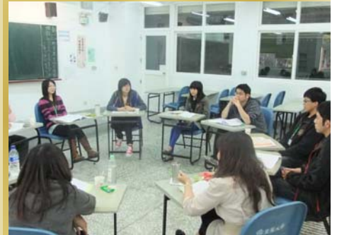
↑※分成小班團體進行活動