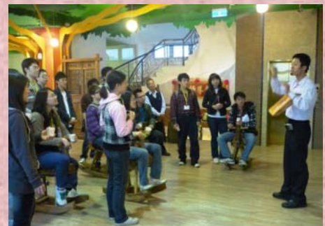
↑※導覽人員仔細的講解宜蘭餅歷史