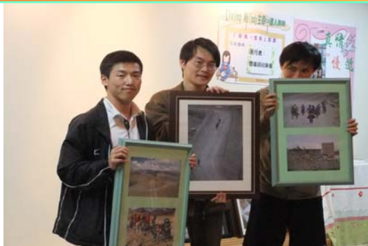
↑※同學們驕傲的展示作品。