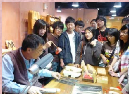
↑※聚精會神的看師父精湛的手藝