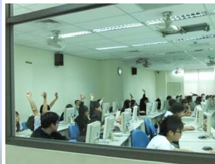
↑※同學踴躍與老師互動