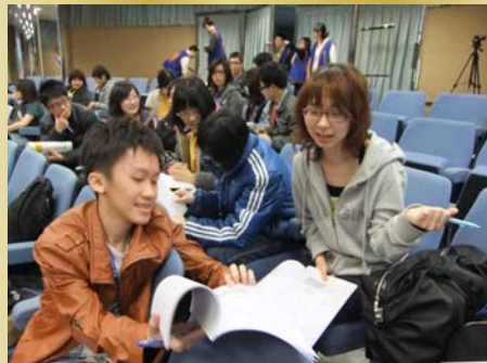
↑※同學們熱烈的討論著