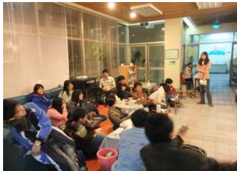
↑※彼此分享生命經驗，發言就能拿大獎喔！