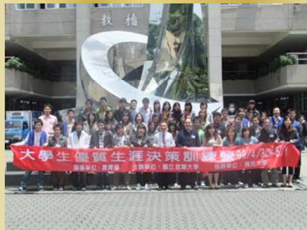
↑※活動正式開始前的大合照～

本次活動高度的滿意，根據回饋問卷的調查，講座方面整體平均分數為 90.75%，課程安排上也有 86.58% 的滿意度，足見此次營隊能符合大多數同學對於解決面臨未來前途抉擇時的焦慮與疑惑的期望。