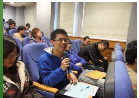
↑ ※諮商股長分享助人心得