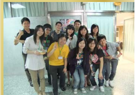
↑※真高興有來參加這個活動