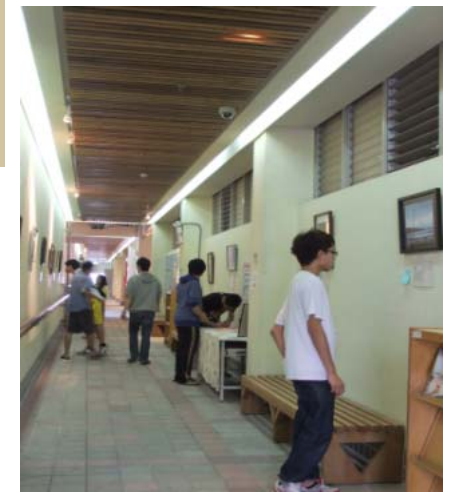
↑※踴躍參觀感受個展魅力並寫下真情留言